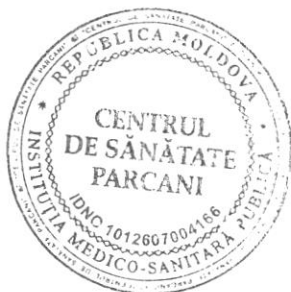
Lilia Procop Șefă a Instituției Medico-Sanitare Publice Centrul de Sănătate Parcani

Rata personalului medical instruit din numărul total de personal medical=100%.Intreg colectivul medical posedă instruirile necesare și categoriile superioare în activitate.